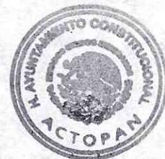
DIRECCIÓN OBRAS PÚBLICAS 2018-2021